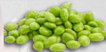
Edamame: origine Autriche