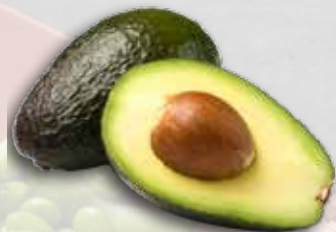
Avocats: origine Pérou